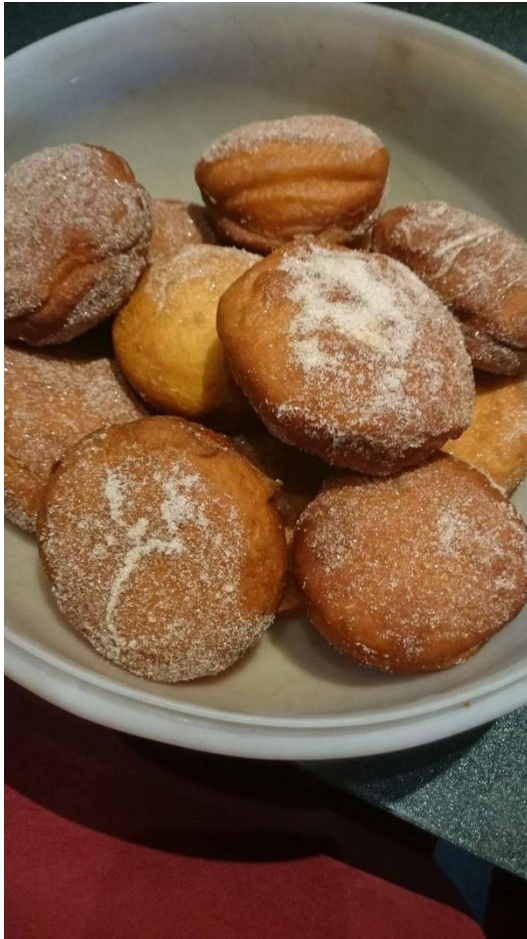
Beignets au chocolat