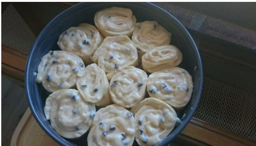
Préparation brioche vanille et pépites de chocolat