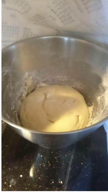
Pâte à brioche